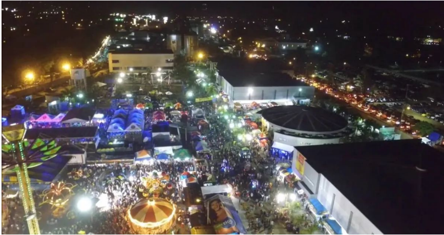
La feria en la ciudad