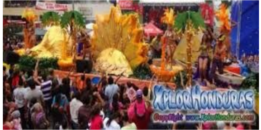
Desfile de carrozas

Conoce San Pedro Sula virtualmente-La capital industrial de Honduras- Abre este enlace