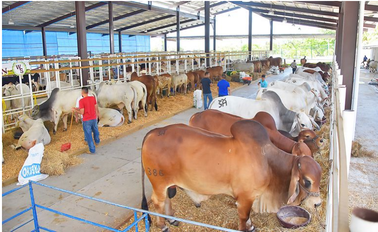
Exposición ganadera durante la feria Juniana